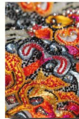
En couverture : Broderie main de Gwendolin Ouarné (détail)