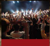
➤ Tambours battant au Fest-Rock