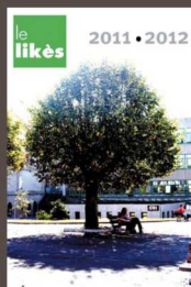
Jules Borgeaud TL