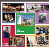
Palmarès 2011 / 2012