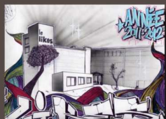
Thibaut Toupin TES1